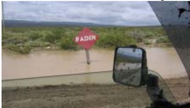
Die erste Schlammschlacht hatten wir nach einer Nacht Regen