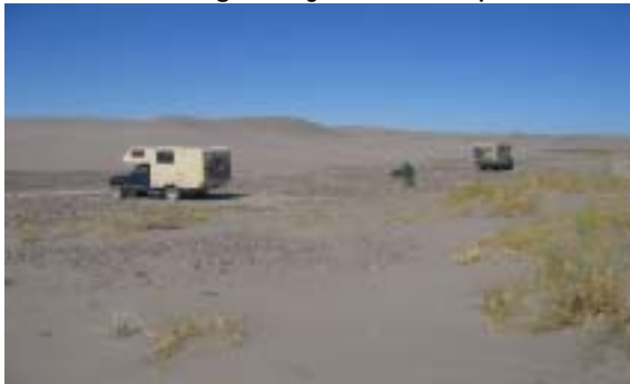
Zwischen Viedma und San Antonio Oeste