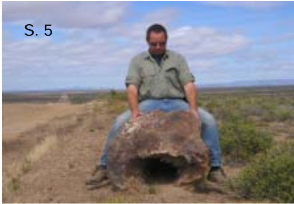
Versteinerter Baumstamm in Patagonien