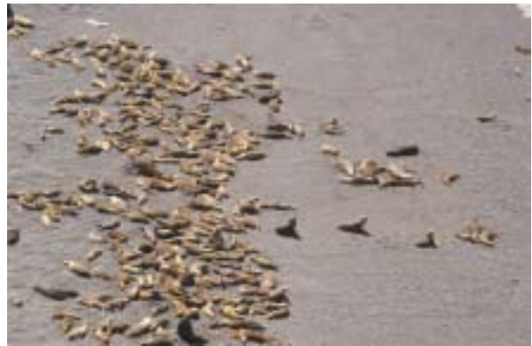
Die Seelöwen waren ziemlich träge