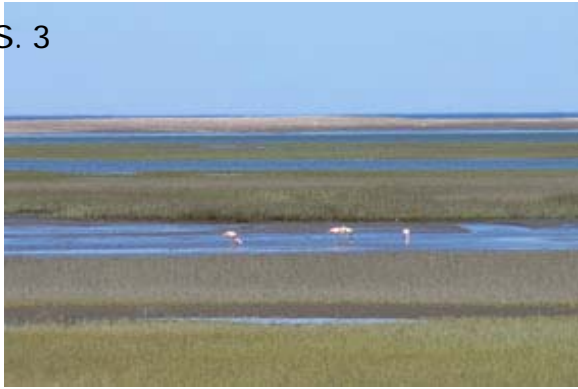
Flamingos in jedem Tümpel