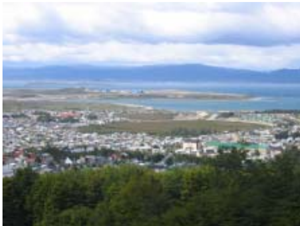
Blick auf den Beagle-Kanal